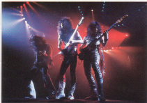
★ LAC ON DEX

ラウドネス、アクションノ、X-RAY、アンセムら、トップ・プロ・ミュージシャン達にも愛され信頼されているESPのヘヴィメタルシリーズ。それぞれのミュージシャンが持つ独特なサウンド・ニュアンス、プレイアビリティ、そしてルックス・イメージなどの高い要求に応え創り上げられたキタームベースです。ボディ材やネック材のセレクト、形状、ハード・ウェアのセレクト、ピックアップのセレクト、そしてフィニッシュ・カラー、これらを全てを一つ一つクリアし、丹念にビルドアップされたクオリティ・モデルです。