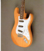
Figured Bass Lark Maple Body